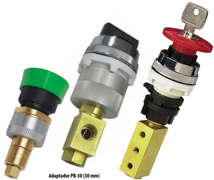
Adaptador PB-22-X (22 mm)

El PB-85 está hecho de plástico y es compatible solamente con actuadores de 30 mm.